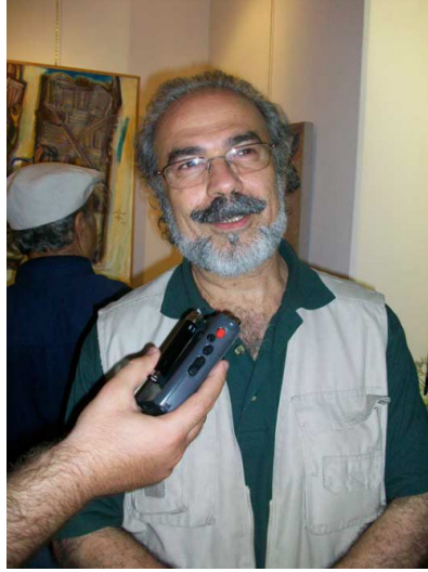
الفنان "محمود شيخاني"