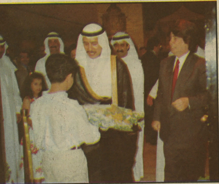
■ الشيخ مبارك فهد الصباح يتلقى باقة زهور في افتتاح المعرض