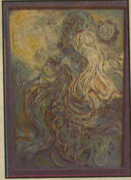
■ من لوحات الفنان هرير