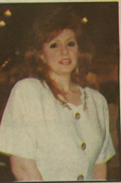
■ سابييه كنفاني