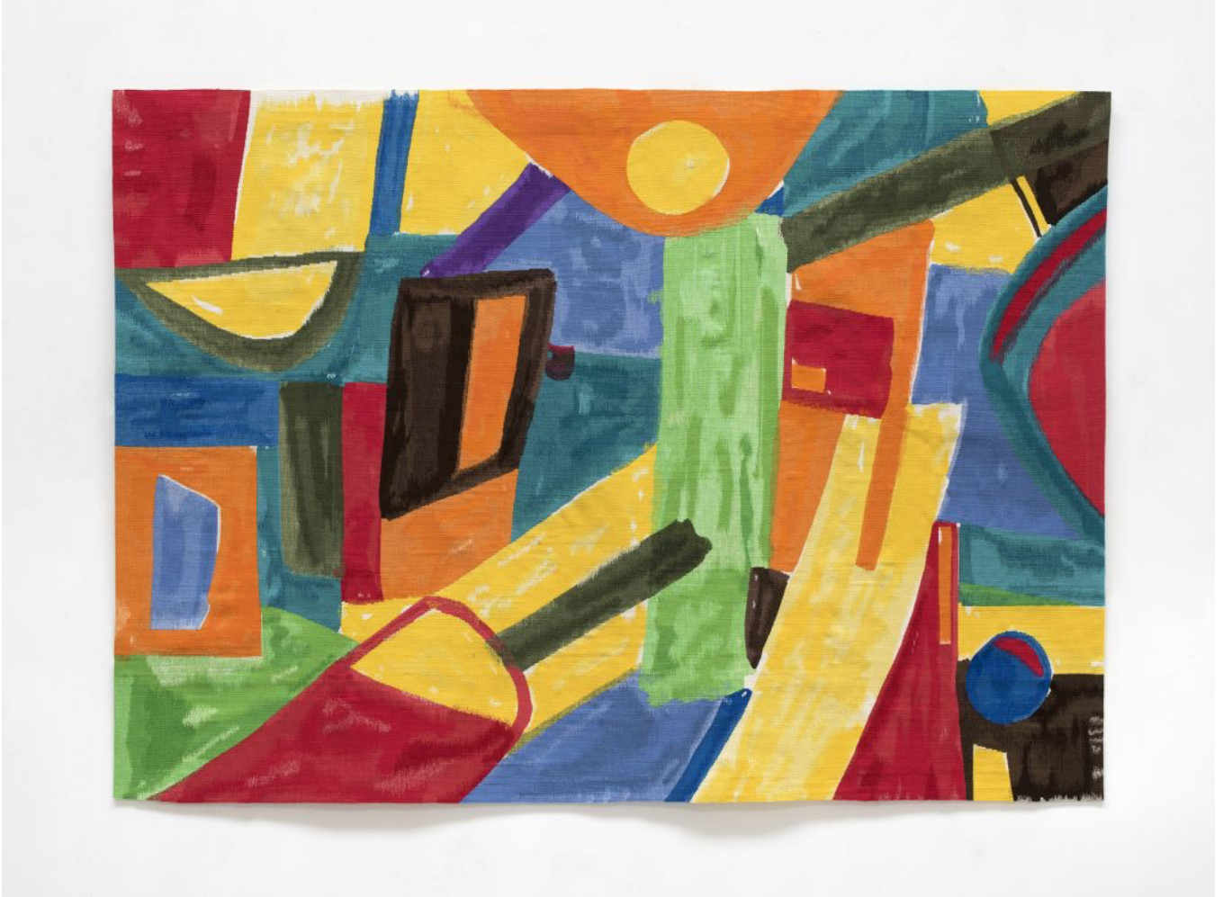
Etel Adnan, « Tout ce que je fais est mémoire » au Château la Coste

On revient sur cette proposition après un prochain passage par le Château la Coste .