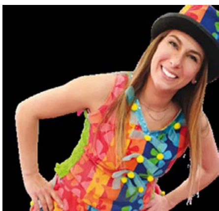
ACTIVITÉS À FAIRE POUR LES PETITS ET LES GRANDS