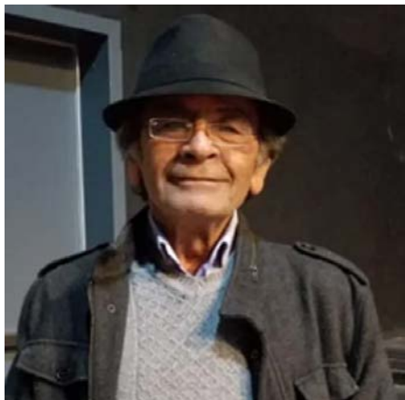
LA DANSEUSE ET LE PHILOSOPHE