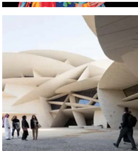
OUVERTURE DU MUSÉE NATIONAL DU QATAR