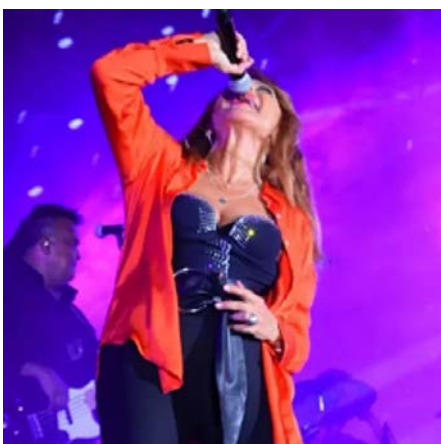
STARS 80 AU WATERFRONT DE BEYROUTH, UNE NUIT DE FOLIE