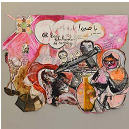
EVÉNEMENTS DANS LE CADRE DE L'EXPOSITION 'THE MOTHER OF DAVID AND GOLIATH' DE MOUNIRA AL SOLH