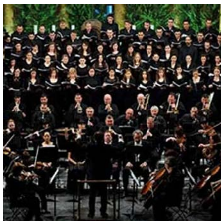
COSI FAN TUTTI OU L'ECOLE DES AMANTS : UN CONCERT MOZARTIEN À NE PAS MANQUER