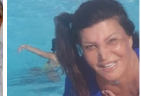
نجوى فؤاد تنشر صوراً لها فى الساحل الشمالى