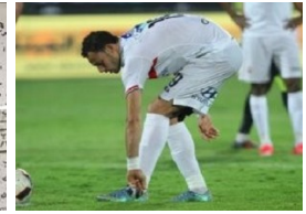
الزمالك يرحب بإجراء صفقة تبادلية مع المصرى بطلها "باولو"