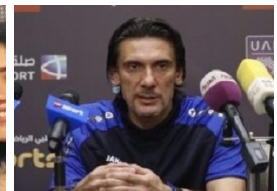
مدرّب الفيصلى يعتذر عن تصرفات الجماهير عقب نهائى البطولة العربية