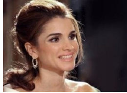
على طريقة الملكة رانيا اتعلمى مكياج خفيف