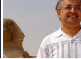
عالم مصريات: العثور على مقبرة تنتمى لستى الثاينى بالمنيا تصريح فى غاية الخطورة