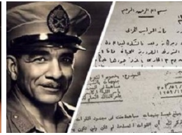
محمد نجيب وأسراره فى العدد الجديد من كتاب الجمهورية