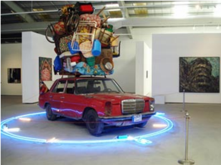
Ayman Baalbaki: Destination X (Rose Issa Projects)

La photographie «Hassan's Angel-Khadija» du Marocain Hassan Hajjaj montrant une femme voilée sur un scooter joue sur la relation ambiguë entre stéréotypes et réalité, tradition et modernité : Tout en étant voilée, elle montre ses mollets nus, porte des lunettes de soleil, dans un cadre composé de canettes de fanta.