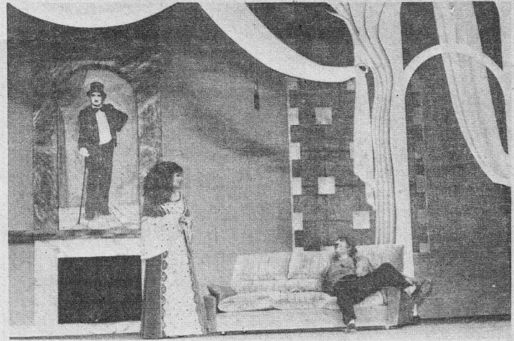
ناس القصر ليسوا هم ناس القصر

للحالات حيث يمر بعض اللبنانيين في كوميديا نبيه ابو الحسن اتهام المجتمع الدولي بالازمة التي تحرق الوطن. كأنه يتبنى مقولة المؤامرة الدولية (والعربية) على الشعب لاغراقه في ثورة الانهيار المستمر. ما يفوق الممثل الى الكلام على القضية والمسؤوليات والضحايا والعملاء ودور الصحافة (جرايد للبيع) وهي في أن الجلاء والضحية، ودخول اللبنانيين انفسهم كطرف مباشر ومسؤول عن جعل وطنهم بين ايادي الاجانب والاشقاء والضيوف الذين اعتدوا على شرعة الضيافة.