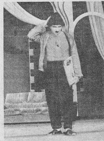
من ضد من بين "مسرح التحرير" و"بار نعيمة المصرية"؟ (كميل حداد)