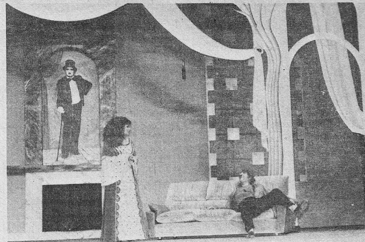
ناس القصر ليسوا هم ناس القصر

للحالات حيث يمر بعض اللبنانيين . في كوميديا نبيه ابو الحسن اتهام المجتمع الدولي بالازمة التي تحرق الوطن . كأنه يتبنى مقولة المؤامرة الدولية (والعربية) على الشعب لاغراقه في ثورة الانهيار المستمر . ما يقود الممثل الى الكلام على القضية والمسؤوليات والضحايا والمعلماء ودور الصحافة (جرايد للبيع) وهي في آن الجراد والضحية، ودخول اللبنانيين انفسهم كطرف مباشر ومسؤول عن جعل وطنهم بين ايادي الاجانب والاشقاء والضيوف الذين اعتدوا على شرعة الضيافة . كما كوميديا نبيه ابو الحسن (انه بطلها ومؤلفها ومخرجها) تقف موقفا مباشرا، على طريقة المسرح السياسي المتداول عند بعض مسرحيين، من الحوادث اللبنانية . تستعير منها صورها وعناوينها وشعاراتها وامثولتها . حتى تجد الجمهور يتعرف عفويا الامور . ويتجاوب معها سلبا او ايجابا . بالتصفيق او بالضحك او بانتظار ما سيأتي . وفي العمل الجهد الرصين في الاستعانة بالافنعة (ناس القصر ليسوا هم ناس القصر) . وبالرجال التاريخيين للاستقلال (بشارة ورياض) . وبالرموز الدوليين (طرزان كارتر وطرزان بريجنيف في حديقة الحيوانات المتحدة) . وبالايعاءات العربية واللبنانية (من ضد من على ساحة البرج؟) . لاكمال مشاهدة، لكي تصل بوضوح الى ناس الصالة .