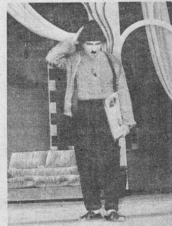
من ضد من بين "مسرح التحرير" و"بار نعيمة المصرية"؟ (كميل حداد)