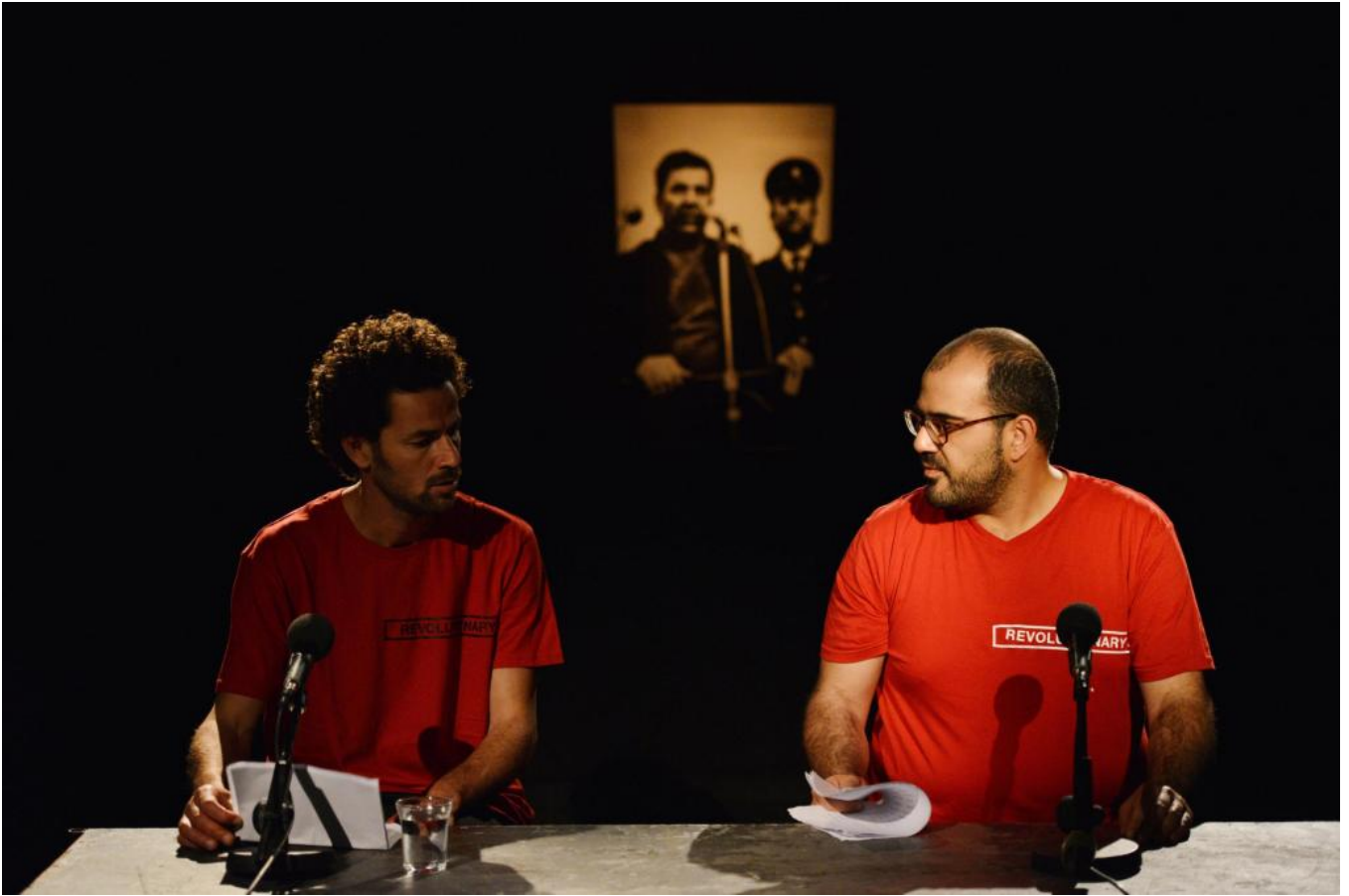
Aissa Deebi – The Trial (Capture d'écran)