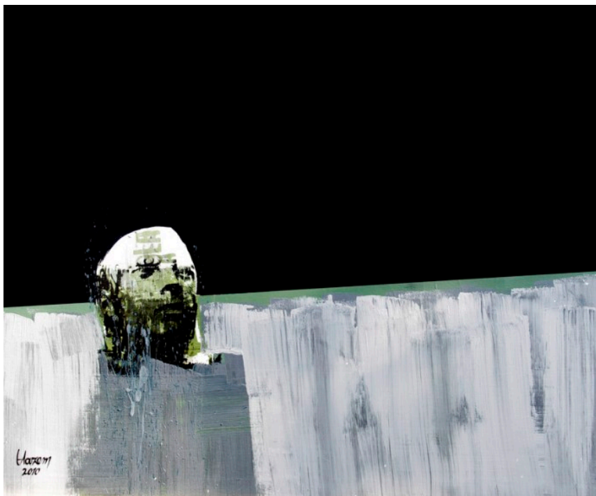
Hazem Harb – Invisibility series

L'artiste Hazem Harb originaire de Gaza aujourd'hui en exil entre Rome et Dubaï, explore le thème de l'existence, à travers un point de vue très personnel et original. Dans sa série de peintures inédites – il s'agit de la collection privée de l'artiste – intitulée Invisibilité (2010), inspirée de l'art conceptuel et de l'expressionnisme, l'artiste dépeint des formes humaines stylisées : on devine çà et là une jambe, une main ou un visage désarticulé, décharné, à peine identifiable. Evoquant l'œuvre de Francis Bacon, des fragments de corps en mouvement se heurtent à des compositions géométriques dans lesquelles ils entrent violemment, comme par effraction. Doté d'une grande maîtrise technique (entre jets et aplats de peintures), l'artiste qui a entrepris ce projet à la suite de la guerre « Plomb Durci » de 2008 sur Gaza, rend les conséquences désastreuses de la guerre plus manifestes encore par la matérialité de la peinture. A l'instar de Goya ou de Picasso, c'est un art qui alerte, qui dénonce les horreurs de la guerre et la vulnérabilité humaine.