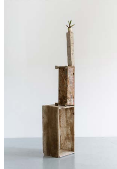
Overzealous self portrait comparing sexual behavior in chimpanzee and bonobo, reading 'Petrolio' by Pier Paolo Pasolini and listening to Outkast 'The Whole World', 2014