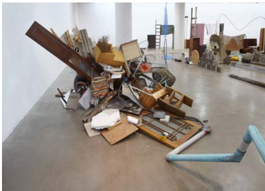
Vue de l'exposition Autodestrucción 8: Sinbyeong, Artsonje Center, Séoul, Corée du Sud, 2015