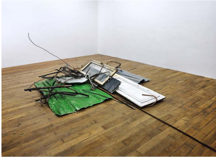
Autodestrucción 3 : Mots et choses, 2013