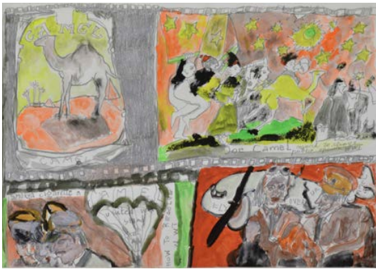
Cotton-Suez Canal, Camel, 2011