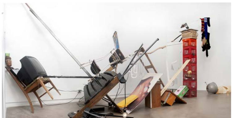
Vue d'exposition, Agustina Ferreyra Gallery, San Juan Puerto Rico, 2016