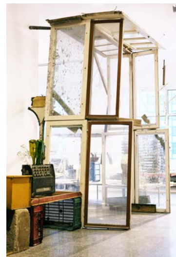
Vue de l'exposition Autodestruccion 6, Gdanska City Gallery 2, Gdansk, 2015