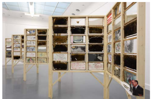
The Salt Traders, 2015