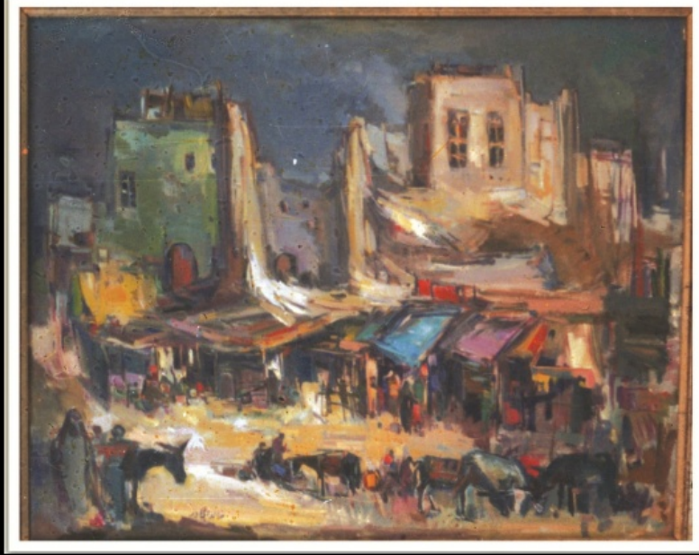
Khaled Al Jader

كتابة: أسماء سعد الدين آخر تحديث: 20 مارس 2017 , 14:53