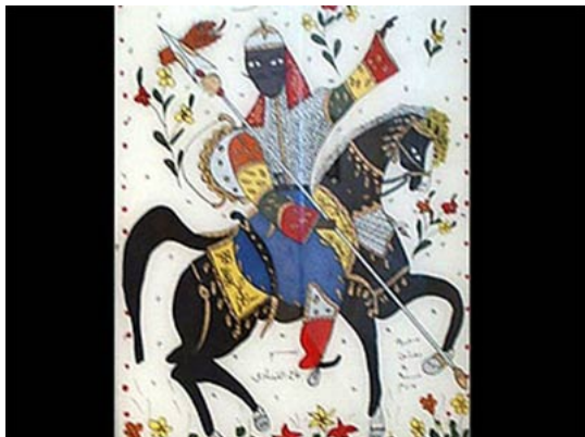
أبو الفوارس عنتره، أبو صبحي التيناوي