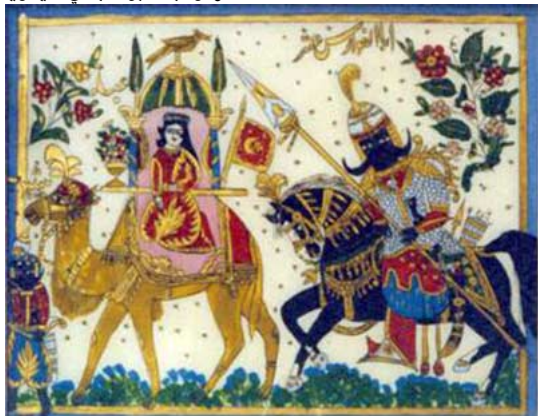
عنتره وعبلة، أبو صبحي التيناوي