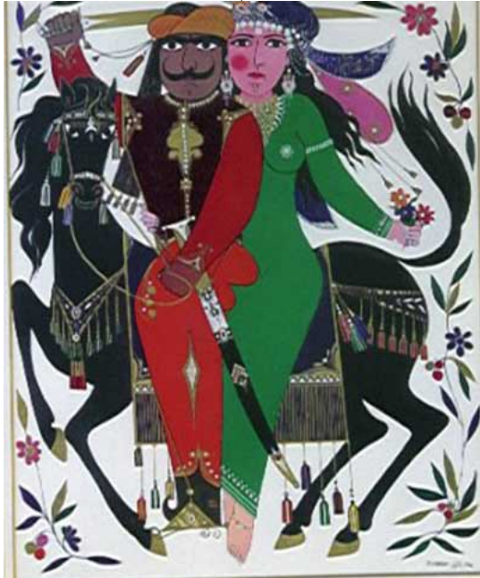
"مجموعة رسوم لرفيق شرف حول سيرة "عنترة و عيلة"