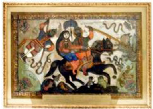
"عنترة و عيلة على مطيتهما"