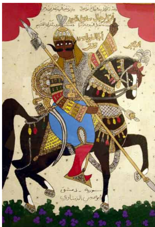
أبو الفوارس عنتره، أبو صبحي التيناوي

• تعد سيرة "عنتره و عبله" [1] في الأدب وتاريخ الميثولوجيا، من روائع الملاحم القصصية. والملحمة كما نعلم هي حكاية حياة الأبطال التاريخيين أو القديسين، والقادة العظماء عند الشعوب والأمم، ممن سموا إلى مراتب الإنسان -الأعلى أو «الإنسان الكامل. ومع أن هؤلاء هم في العادة بشر عاديون من أمثال عنتره، و الزير سالم، والجازية... إلا أنهم احتلوا في الوجدان الشعبي مراتب القديسين الشهداء أصحاب البطولات والكرامات والمقامات الدينية.