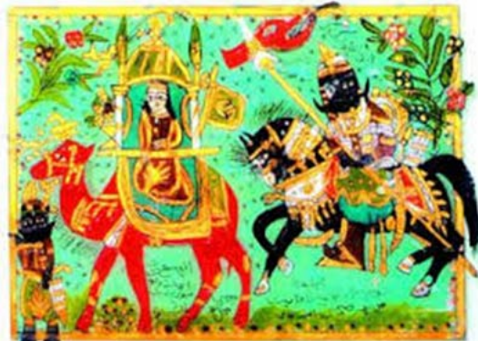
عنتره وعبلة، أبو صبحي التيناوي