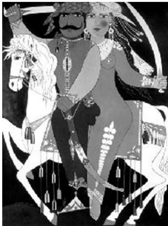
"مجموعة رسوم لرفيق شرف حول سيرة "عنتره و عبله"