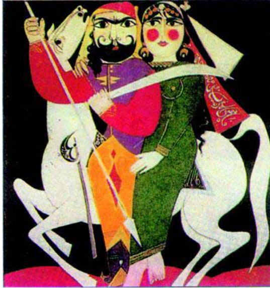
"مجموعة رسوم لرفيق شرف حول سيرة "عنترة و عيلة"