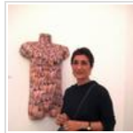
أن تكون رجلاً !