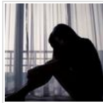
لما شملني ربنا بعطفه