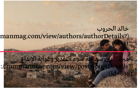
خالد الحروب rommanmag.com/view/authors/authorDetails? (id=11) "أميرة" بن سماحة سوء التقدير وغواية الإبداع s://rommanmag.com/view/posts/postDetails? (id=6381)