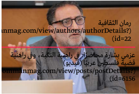
رمان الثقافية rommanmag.com/view/authors/authorDetails? (id=22) عزمي بشارة محاضرًا في راهنية التكية، وفي راهنية قضية فلسطين عربيًا (فيديو) rommanmag.com/view/posts/postDetails? (id=6156)

هدايا ثقافية بنشر لأول مرة : rommanmag.com/view/authors/authorDetails? (id=22) مع الشهيد غسان كنفاني كنفاني... عن الطفولة والأدب والماركسية والجهة والهدف s://rommanmag.com/view/posts/postDetails? (id=6495)