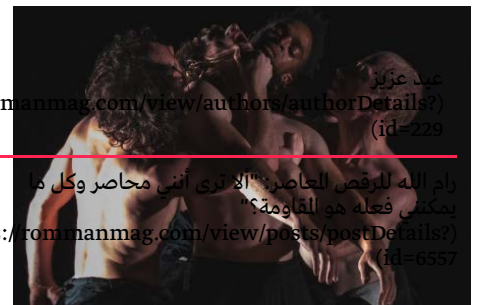
عبد عزيز rommanmag.com/view/authors/authorDetails? (id=229) رام الله للرقص المعاصر: "الأثرى أنتي محاصر وكل ما يمكن فعله هو المقاومة" s://rommanmag.com/view/posts/postDetails? (id=6557)