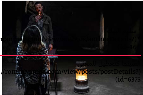
rommanmag.com/view/authors/authorDetails? (id=22) الطبيب يعطون للمسيح s://rommanmag.com/view/posts/postDetails? (id=6375)