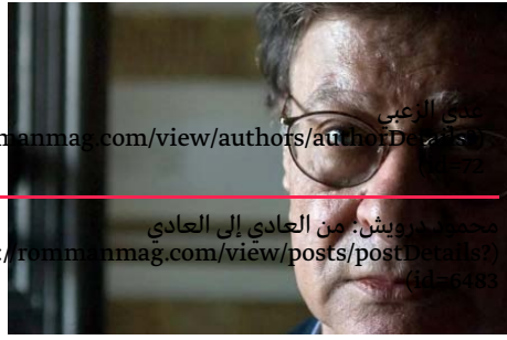
علي الرابي rommanmag.com/view/authors/authorDetails? (id=22) محمد مر ويثن: من العادي إلى العادي s://rommanmag.com/view/posts/postDetails? (id=6483)

هدايا ثقافية بنشر لأول مرة : rommanmag.com/view/authors/authorDetails? (id=22) مع الشهيد غسان كنفاني كنفاني... عن الطفولة والأدب والماركسية والجهة والهدف s://rommanmag.com/view/posts/postDetails? (id=6495)