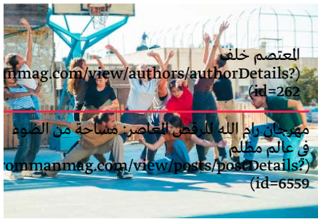
العتصم خلف rommanmag.com/view/authors/authorDetails? (id=262) مهرجان رام الله للرقص المعاصر: مساحة من الضوء في عالم مظلم rommanmag.com/view/posts/postDetails? (id=6559)