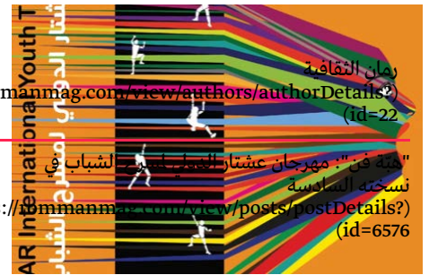
رمان الثقافة rommanmag.com/view/authors/authorDetails? (id=22) "مئة فن": مهرجان عشائر الحميلة في شباب في نسخته السادسة s://rommanmag.com/view/posts/postDetails? (id=6576)