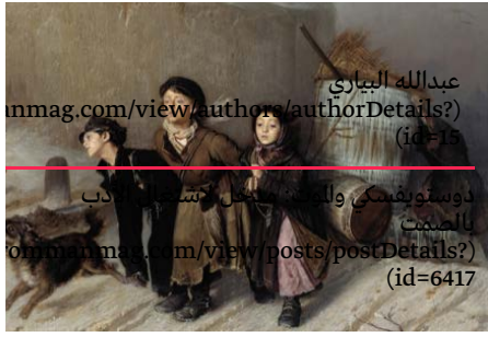
عبدالله البياري rommanmag.com/view/authors/authorDetails? (id=15) دوستوفسكي ولما كان يدخل مستشفى rommanmag.com/view/posts/postDetails? (id=6417)