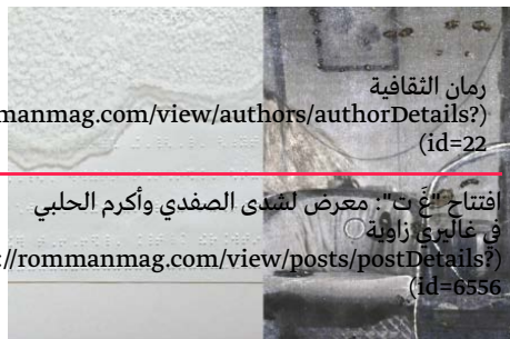
رمان الثقافية rommanmag.com/view/authors/authorDetails? (id=22) افتتاح "ع"ت": معرض لشهدى الصفدي وأكرم الحلبي في غاليري زاوية s://rommanmag.com/view/posts/postDetails? (id=6556)