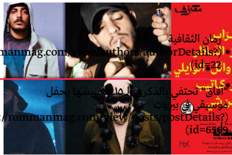
رمان الثقافية rommanmag.com/view/authors/authorDetails? (id=22) وان رايي "أفاق" تحنفي بالذكر في 15 أغسطس حفل موسيقى في بيروت s://rommanmag.com/view/posts/postDetails? (id=6569)