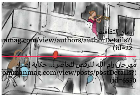
رمان الثقافية rommanmag.com/view/authors/authorDetails? (id=22) مهرجان رام الله للرقص المعاصر... حكاية إصرار rommanmag.com/view/posts/postDetails? (id=6550)