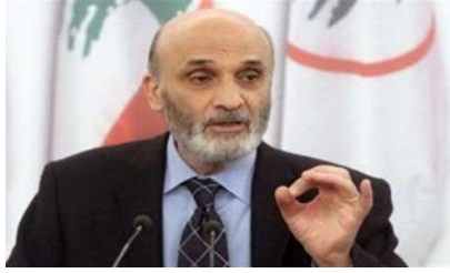
"المعركة مستمرة".. موقف جعجع من رفع الحصانات!