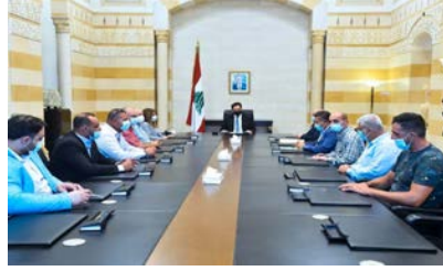
مشاكل عمال البلديات على طاولة دياب