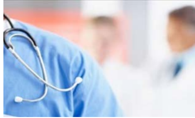
اتحاد بلديات البترون: على مستشفى البترون الادعاء على المتهم