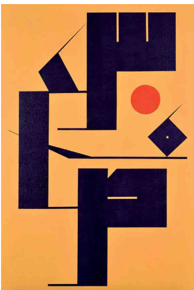
الزخرفة والخط العربي يتزاوجان عند الصايغ

الهندسية التبسيطية، الجسور بين تقليدين فنيين متفاوتين زمنيا، وهي في ذلك تقدم مساهمة فريدة تغني تاريخ الحداثة. ومعرض «ألف بحروف كثيرة» هو امتداد للكتاب الذي أصدره الخطاط سميير الصايغ تحت نفس الاسم، حيث تعمل النصوص والأعمال الفنية معا على تحرير فن الخط العربي من قيود اللغة ورفعها إلى آفاق أسمي، وجعله فن قراءة اللامقروء، وسماع اللامسموع، ورؤية ما يستغل على الرؤية. وسميير الصايغ فنان وشاعر وكاتب وناقد فني ومؤرخ، كرس نفسه من خلال فنه كليا لفن الخط العربي، ويعتبر واحدا من أهم رواد جيله العرب في فن الخط حيث يتمسك الصايغ بالخط العربي المزخرف، ويركز على القيمة الجمالية المطلقة المتصلة في جوهر الخط أكثر من تركيزه على المعنى الحرفي للكلمة.