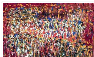
Amine Demnati ou la mémoire