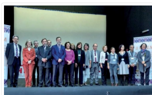
Clôture du deuxième congrès de