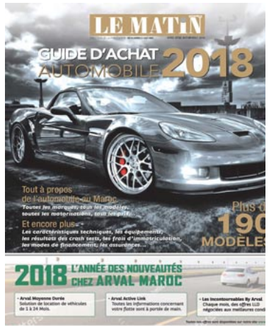
( https://epaper.lematin.ma/special/hors-serie/2017/12/28/ )