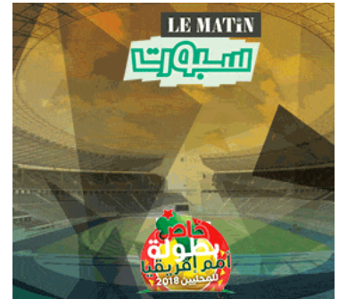
( https://lematin.ma/ar/sports/ )

Côté contemporain, la Marocaine des arts présentera des œuvres de Mounir Fatmi, Fatiha Zemmouri, Safaa Erruas, Badr Bourbian, Mounat Cherrat... qui comptent parmi les artistes les mieux côtés de leur génération. Enfin, cette vente se distinguera également par son caractère philanthropique : en effet, une dizaine d'œuvres d'exceptions seront mises aux enchères à la fin de cette vente au profit de la fondation Ali Zaoua créatrice du centre culturel Les Étoiles de Sidi Moumen, fondée par Nabil Ayouch et Mahi Bine Bine. Cette association, visant à offrir un accès à la culture de proximité aux jeunes du quartier Sidi Moumen, est un lieu d'initiation et de formation aux métiers des arts et de la scène, ainsi