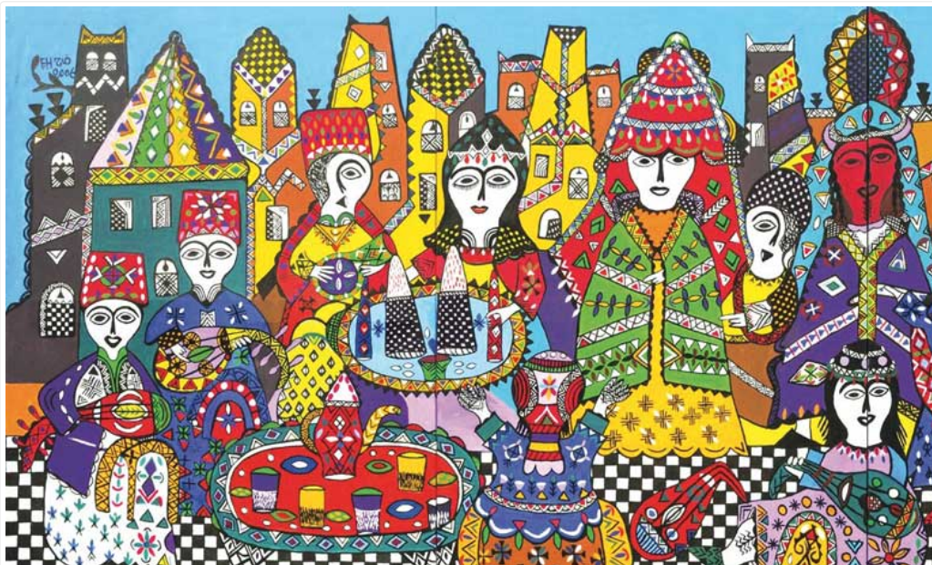
Une oeuvre de l'artiste-peintre Fatema Hassan El Ferouj

Le dimanche 17 mai à partir de 17h30 au théâtre du Studio des arts vivants, la Marocaine des arts organisera une vente aux enchères dédiée à l'art moderne et contemporain marocain. Les bénéfices d'une dizaine de lots seront reversés à la Fondation Ali Zaoua fondée par Nabil Ayouch et Mahi Binebine.