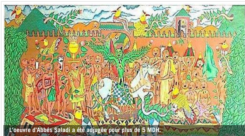
L'oeuvre d'Abbés Saladi a été adjugée pour plus de 5 MDH.

Par Le360 le 10/06/2015 à 10h30 (mise à jour le 10/06/2015 à 10h34)