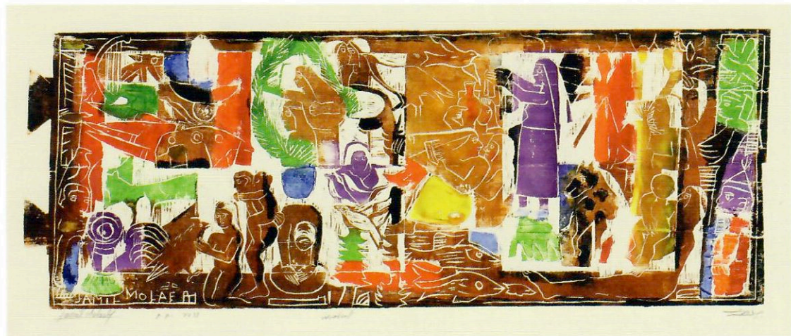
Celebrations , woodcut and print, 2013. 33 x 90 cm