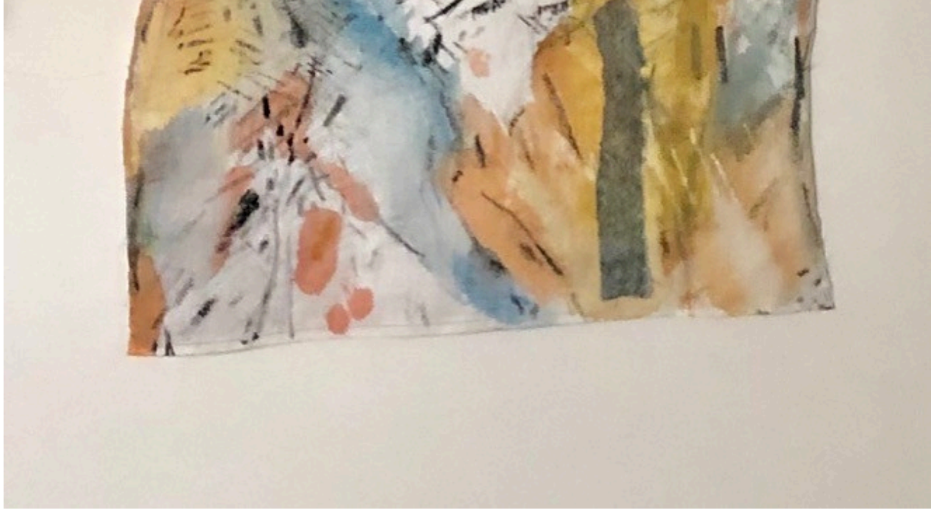
فجر، فيرا تماري، 2019