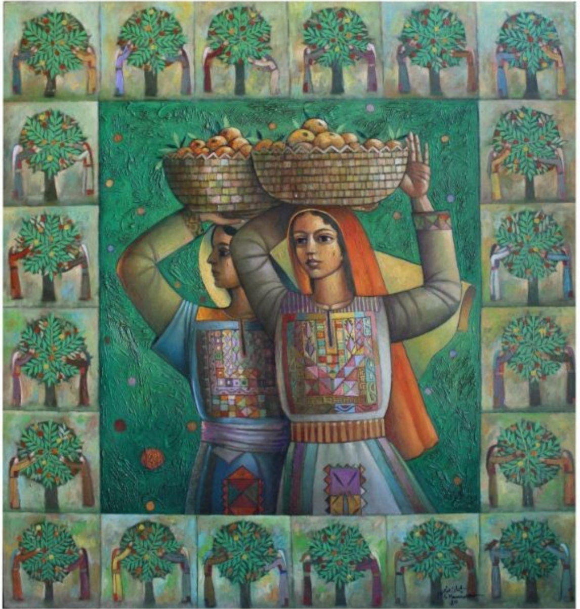
بدون عنوان، سليمان منصور، 1984