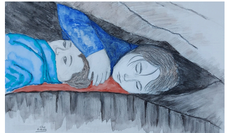
أعطونا الطفولة | معرض رقمي

(/بصر/معرض/2024/03/11/كل- المجازر-تشابه-|معرض-رقمي)