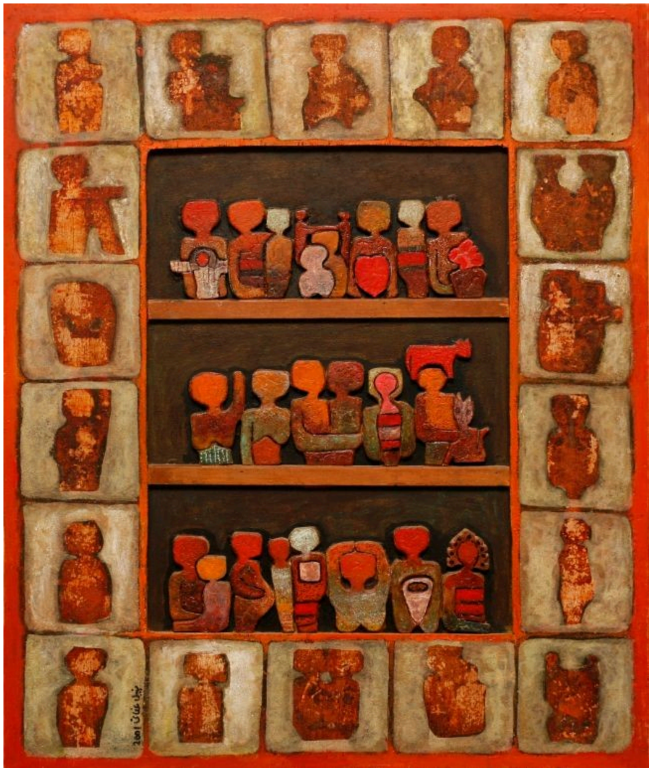
بدون عنوان، نبيل عناني، 2001