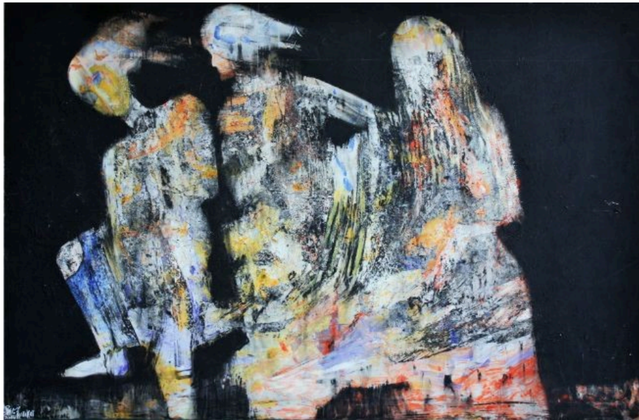
زفاف، تيسير برکات، 2014