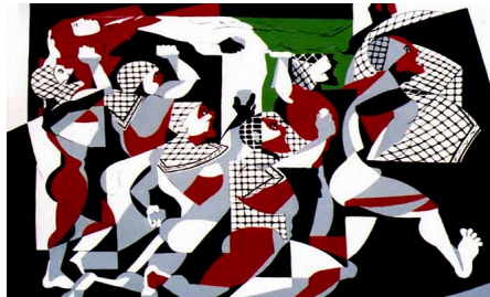
كلّ المجازر تتشابه | معرض رقمي

(/بصر/معرض/2024/02/22/شاشة- صامتة-|معرض-رقمي)