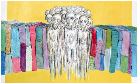
شاشة صامتة | معرض رقمي

(/بصر/معرض/2024/02/22/شاشة- صامتة-|معرض-رقمي)